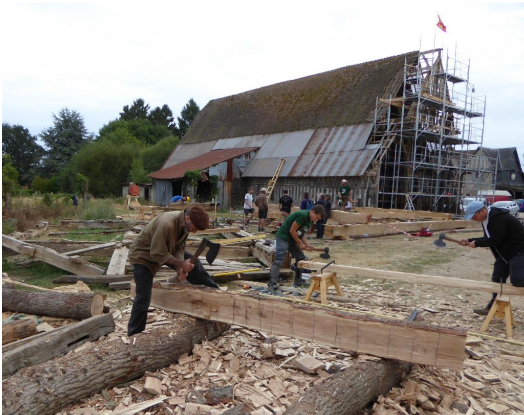
Chantier traditionnel « Charpentiers sans frontière », Aclou (Eure), 2016 (Cl. F. Epaud).

Dans l'hypothèse où les choix de restauration se porteraient sur une charpente en bois, on peut imaginer un chantier-école de ce type sur le parvis de Notre-Dame, avec des dizaines de charpentiers équarrisant à la hache des grumes et taillant les bois manuellement selon les règles ancestrales du métier, qui permettrait aux entreprises de renouer le lien avec un savoir-faire pluriséculaire, dans l'esprit et la continuité des chantiers des cathédrales. Un tel chantier serait sans nul doute spectaculaire et très émouvant auprès du grand public car il témoignerait du respect de notre époque pour un patrimoine gestuel et technique qui se doit d'être préservé comme élément de notre identité culturelle et encore plus sur l'un des monuments les plus chers à la nation. Quant au type de charpente, un compromis entre une structure en bois d'inspiration médiévale et contemporaine, employant les techniques de la charpenterie traditionnelle héritée du XIII e siècle mérite réflexion, ce qui permettrait en même temps de valoriser nos ressources forestières selon une éthique écologique très ancrée dans le XXI e siècle.