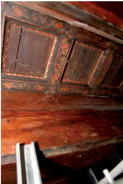
2 - Perpignan, maison rue des Marchands, plafond peint. Caissons peints, décor de phylactères, détail.