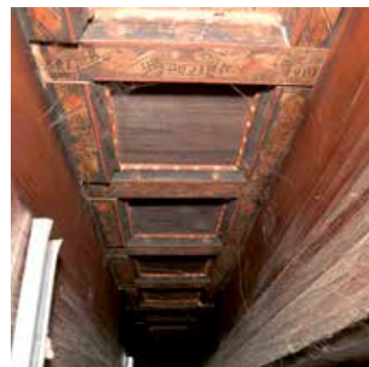
1 - Perpignan, maison rue des Marchands, plafond peint. Vue du plafond entre deux poutres. Caissons peints, décor de phylactères.