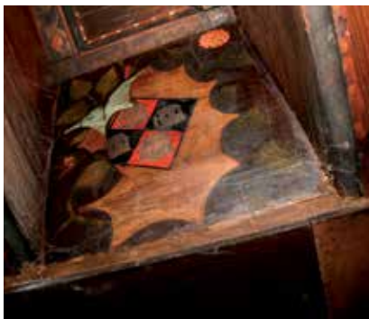
3 - Perpignan, maison rue des Marchands, plafond peint. Cloisir au décor végétal et peut-être armoiries d'une famille.