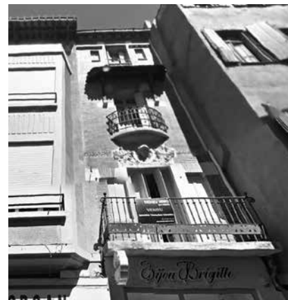
5 - Perpignan, rue des Marchands. La maison où se trouve le plafond peint (au-dessus de la bijouterie), avec sa façade « art nouveau », entre les maisons aux encorbellements conservés.

Dès l'introduction 3 apparaît clairement l'intérêt du livre et de la démarche mise en œuvre. D'un point de vue méthodologique, l'ouvrage combine les techniques traditionnelles d'étude en histoire de l'art et les nouvelles technologies scientifiques appliquées à l'analyse des œuvres. Si la thématique de la peinture romane en Catalogne a fait l'objet d'études, il faut admettre qu'il était nécessaire de combler une lacune effective : le manque d'approfondissement de la question concernant l'aspect matériel et technique. Or, mettre en connexion la pratique et la matérialité de la peinture médiévale est une démarche indispensable pour bien saisir la genèse et le développement de cette dernière. Le tout a également été connecté au contexte culturel, politique et ecclésiastique, ceci permettant de proposer une analyse sociologique des commanditaires et artistes. Les analyses de laboratoire ont permis de renouveler cette approche et le travail avec les restaurateurs a permis d'essayer de répondre à de multiples questions : quelles sont les origines de la peinture sur bois en Catalogne ? Comment sont formés les maîtres ? Qui étaient-ils et avec quelles couleurs peignaient-ils ? Quel est le lien entre la pratique picturale et les traités professionnels ? Quels étaient les profils des artistes ?