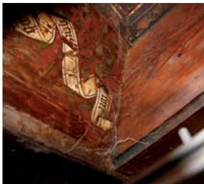
4 - Perpignan, maison rue des Marchands, plafond peint. Cloisir au décor végétal et phylactère avec inscription en caractères gothiques.

Sur place nous avons découvert des peintures d'une fraîcheur extraordinaire, qui ne sont visibles que par une toute petite ouverture. On n'aperçoit en effet qu'un intervalle entre deux poutres, où les encadrements des caissons sont tous décorés de rubans portant des inscriptions en caractères gothiques, des phylactères dont le texte est pour l'instant impossible à comprendre.